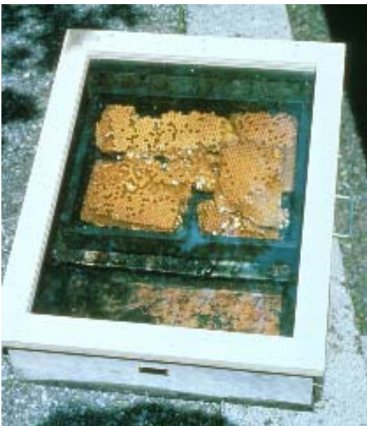
Abb. 2: Solang die alten Waben nicht eingeschmolzen sind, sind sie in Gefahr von den Motten zerstört zu werden.