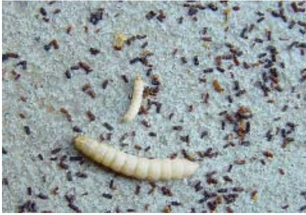
Abb. 1: Zur Kontrolle des Wachsmottenbefalls schiebt man auf dem Boden des Wabenschrankes oder zwischen die Aufsätze des Wabenstapels ein A4-Papier. Regelmässige Kontrolle nach Gemüll und dem typischen Wachsmottenkot weisen auf einen allfälligen Befall hin.