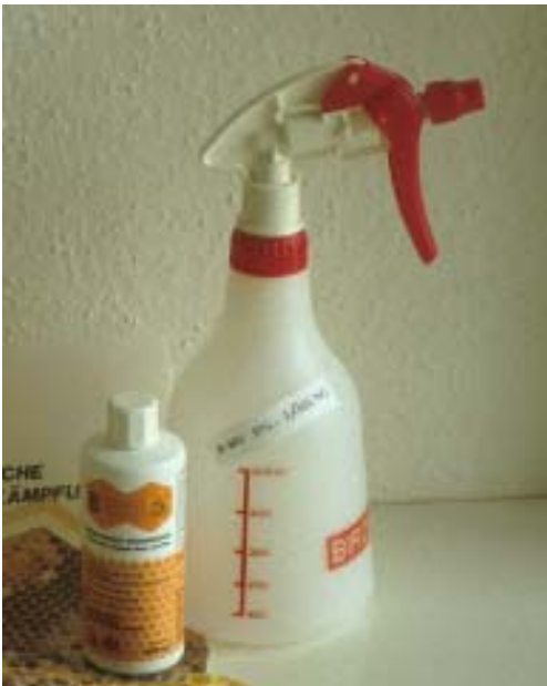
Abb. 4: Das Bakterium Bacillus thuringiensis ist harmlos für Wirbeltiere (Mensch, Haustier) und für Bienen und hinterlässt keine Rückstände im Wachs oder im Honig.