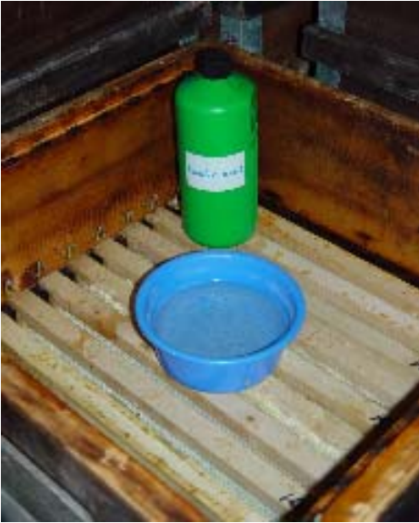
Abb. 6: Da die Essigsäure- wie auch die Ameisensäuredämpfe schwerer sind als Luft, werden die Schale oder das getränkte Filztuch oben auf den Rähmchen platziert.