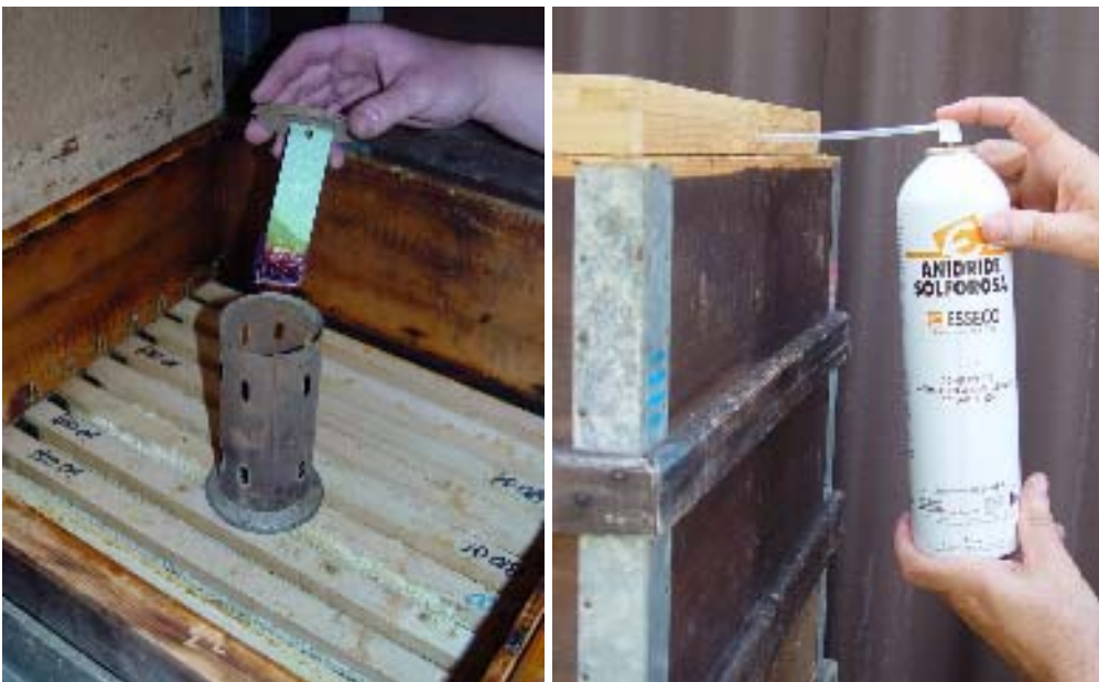
Abb. 5: Schwefelbehandlungen mit Schnitten oder Druckflasche. Mit der Druckflasche kann die Brandgefahr ausgeschlossen werden.