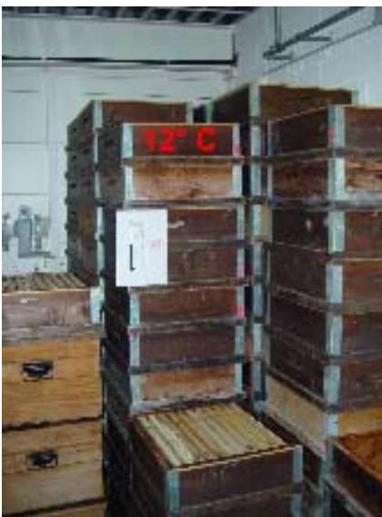
Abb. 3: Bei einer Temperatur von unter 12° C ist eine Entwicklung dieses Schädlings nicht mehr möglich. Für einen grossen Betrieb ist dies die optimalste Lösung.